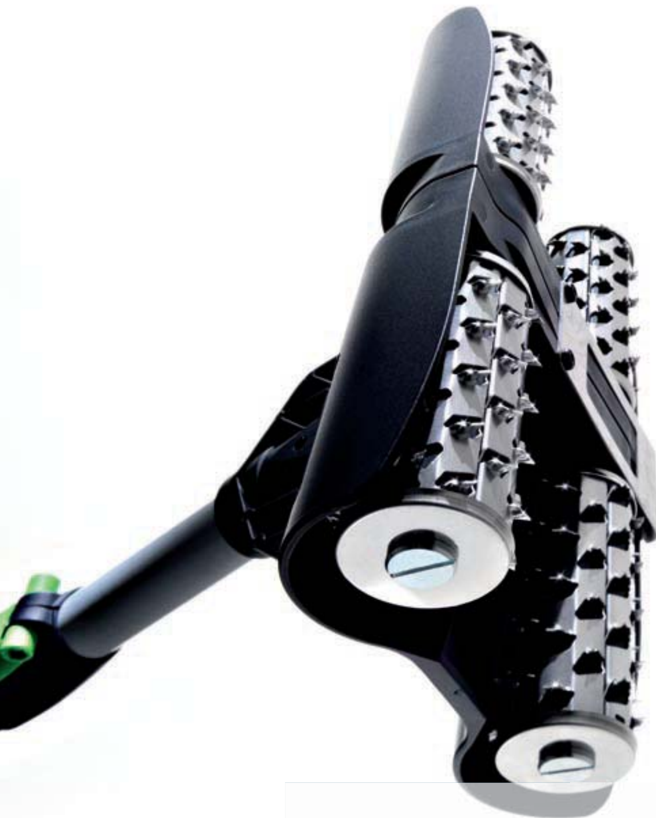
Tapetenperforierer FAKIR TP 220