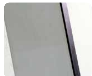
Abb. Best.-Nr. 11211