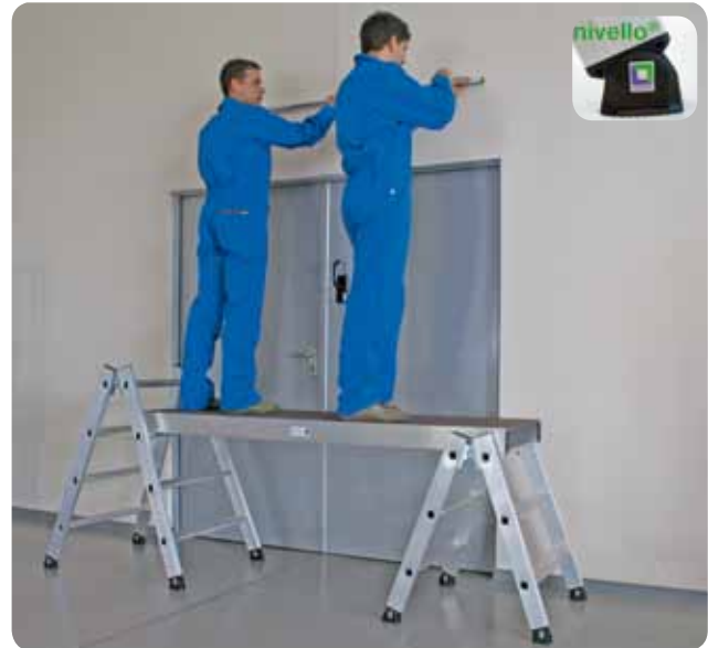
Abb. Best.-Nr. 44206, Best.-Nr. 44208 mit Best.-Nr. 44000.