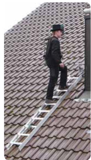
Abb. Best.-Nr. 11113