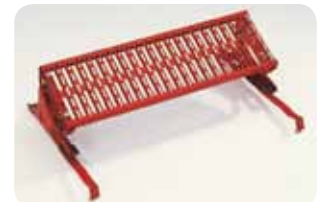
Abb. Best.-Nr. 11176