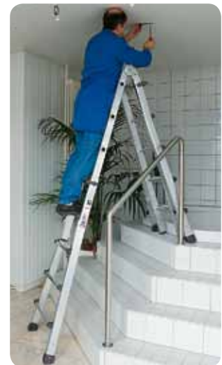
Abb. Best.-Nr. 32017