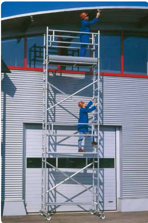
Abb. Best.-Nr. 166520

Wir führen ein umfangreiches Sortiment an Roll- und Klappgerüsten für alle Einsatzbereiche. Fordern Sie kostenfrei den Steigtechnik-Ratgeber an!