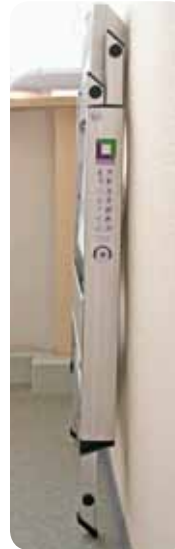
Abb. Best.-Nr. 55003