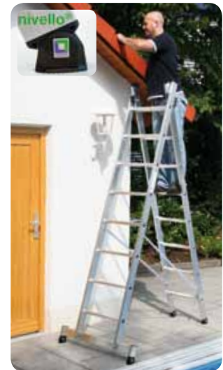
Abb. Best.-Nr. 31216