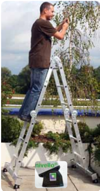
Abb. Best.-Nr. 31312