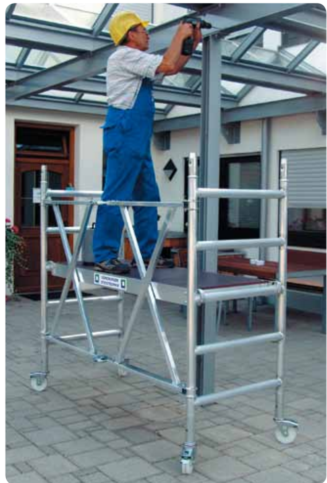
Abb. Best.-Nr. 115301