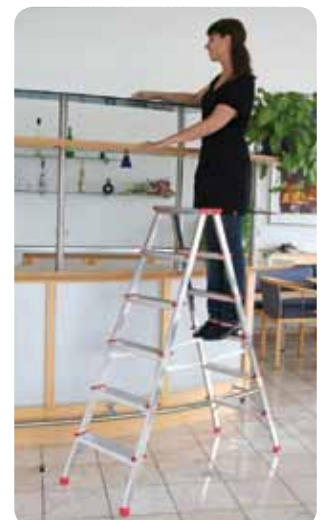
Abb. Best.-Nr. 11166