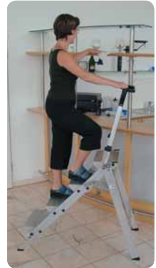
Abb. Best.-Nr. 53104