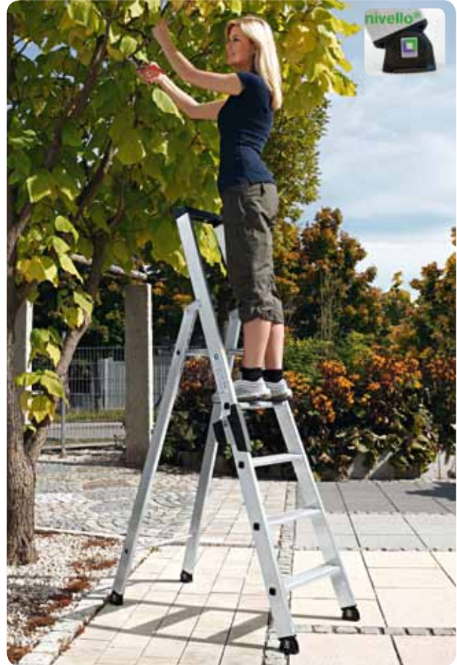
Abb. Best.-Nr. 40105