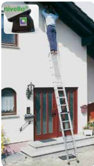
Abb. Best.-Nr. 11104