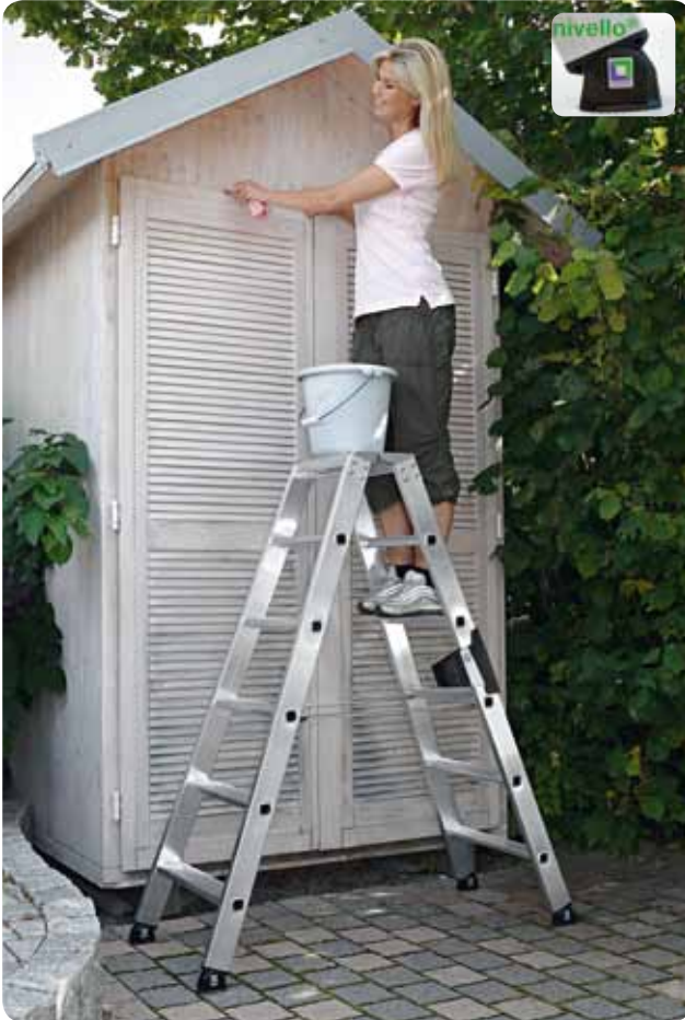
Abb. Best.-Nr. 40212