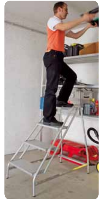
Abb. Best.-Nr. 50052