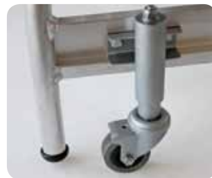
Abb. Best.-Nr. 50068/50069