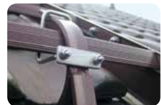
Abb. Best.-Nr. 11204

Standrost 800 x 250 mm, komplett mit Unterbau, zur einfachen Selbstmontage (Anleitung liegt bei).