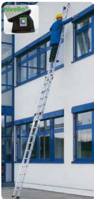
Abb. Best.-Nr. 11105