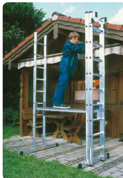
Abb. Best.-Nr. 30299 mit Zubehör Best.-Nr. 30307 und Leiter Best.-Nr. 11108.