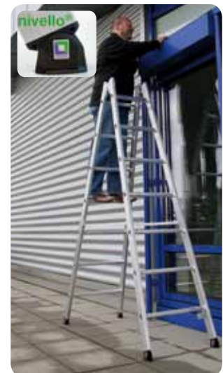
Abb. Best.-Nr. 11154