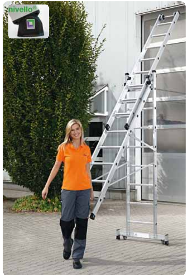
Abb. ähnlich Best.-Nr. 11309.

Rollenmechanismus: einfache manuelle Bedienung.