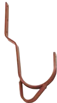
Abb. Best.-Nr. 11119

Klemmhalter zur Befestigung und Sicherung der Dachleiter am unteren Dachhaken gemäß DIN 18160/5.