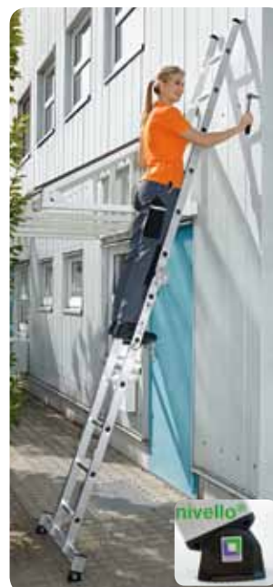
Abb. Best.-Nr. 32212