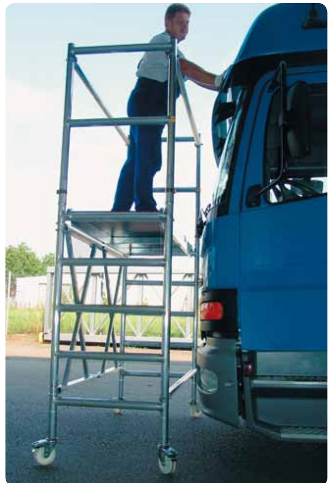
Abb. Best.-Nr. 115601