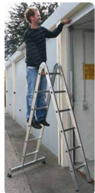
Abb. Best.-Nr. 32212