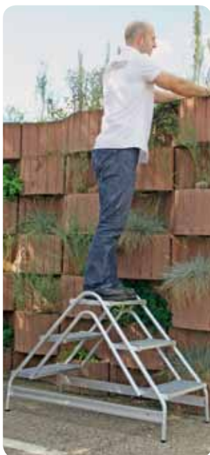
Abb. Best.-Nr. 50063