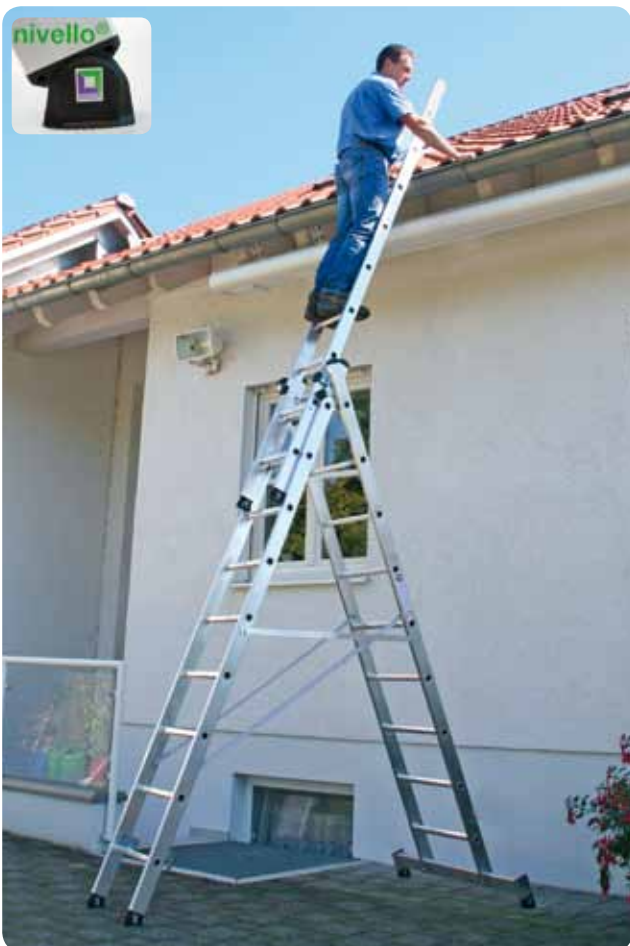
Abb. Best.-Nr. 11108