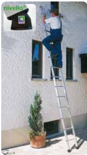
Abb. Best.-Nr. 11151