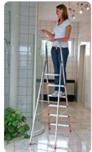
Abb. Best.-Nr. 11127