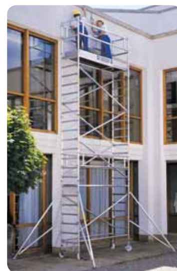
Abb. Best.-Nr. 178635