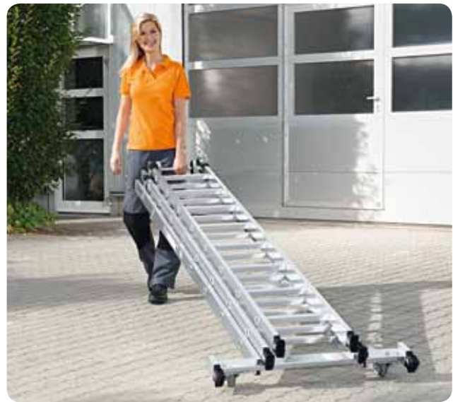
Schnelles und sicheres Verfahren in allen Einsatzpositionen.