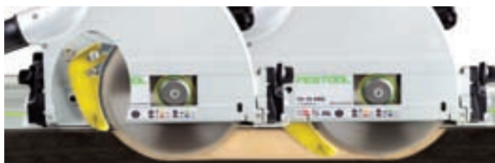
Eingefahrener Spaltkeil beim Eintauchen. Ausgefahrener Spaltkeil beim Sägen.

Rückschlagstopp einfach aus der Garage ziehen und auf der Führungsschiene einsetzen.