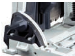
Winkelschnitte sind mit dem Schnittanzeiger genau einstell- und ablesbar.

Denn hier bleibt die Anrisskante auch beim Schwenken des Sägeblatts stets gleich der Schnittkante. Und das von 0° bis 47°, exakt eingestellt an der gut ablesbaren Skala.