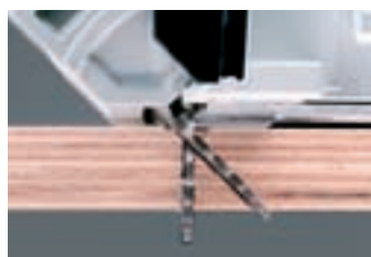
Anrisskante ist gleich Schnittkante, auch bei Winkelschnitten.